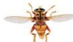
Milésie faux-frelon, Milesia crabroniformis