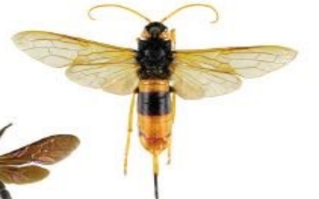
Sirex géant, Urocerus gigas