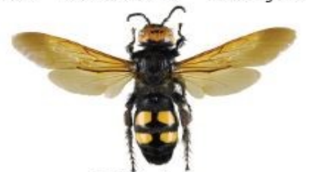
Scolie des jardins, Megascolia maculata flavifrons