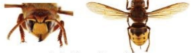
Frelon d'Europe, Vespa crabro