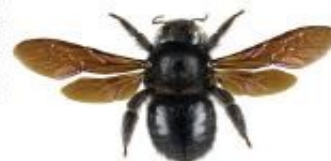
Xylocope ou abeille charpentière, Xylocopa violacea