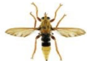
Asile frelon, Asilus crabroniformis