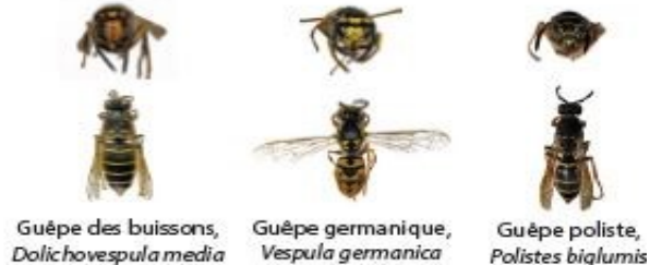
Guêpe des buissons, Dolichovespula media