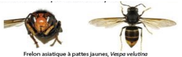
Frelon asiatique à pattes jaunes, Vespa velutina

De nombreuses mouches (Diptères) peuvent ressembler à des guêpes ou des frelons. Mais à la différence de ceux-ci elles ne possèdent qu'une seule paire d'ailes au lieu de deux. Leurs yeux sont généralement beaucoup plus globuleux et leurs antennes plus courtes.