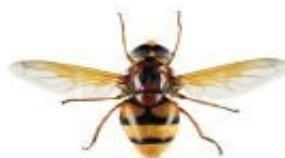
Volucelle zonée, Volucella zonaria